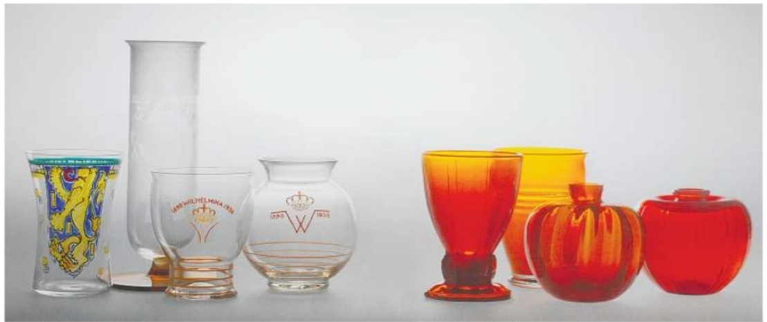
Gelegenheidsontwerpen Koninklijk Huis, 1923-1945: V.I.n.r. Beker (1923), Emmavaas (1933), Vaas (1938), Vaas (1938), Wilhelminabeker (1948), Oranjeboombeaker (1926), Beatrix- of Irenevaasje (1939), Bevrijdingsvaasje (1945)