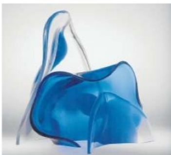
Vazen in de serie Leerdam Serica, 1930-'31, en ondere foto Unica, 1988