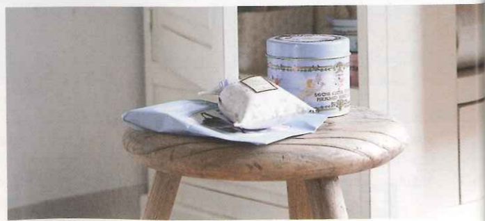
Onder redactie van Jack Meijers Fotografie Studio 5982

In de ruime woonkeuken heeft deze eettafel zijn plek verdiend. Een ware uitnodiging voor een uitgebreide maaltijd en lekker lang natafelen met vrienden en familie. Ook onverwacht gasten kunnen direct aanschuiven wanneer het tafelblad in een handomdraai wordt verlengd.