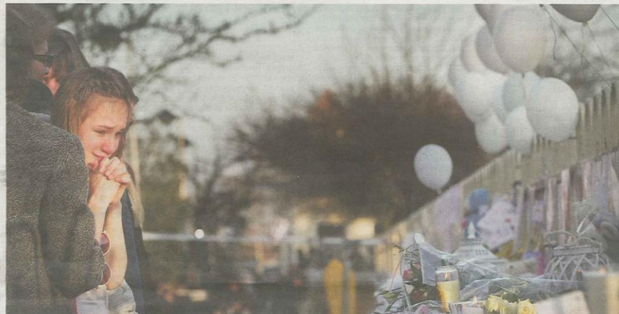
Voor basisschool 't Stekske in het Belgische Lommel groeit de stapel bloemen, kaarten en kaarsjes ter nagedachtenis aan de 28 slachtoffers, onder wie 22 kinderen, van het busongeluk in Zwitserland. Voor vandaag is in